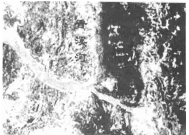
图2 香溪河流域三峡水库移民形成的土壤侵蚀图斑

湖北省三峡水利工程的库区移民工作在国内来说应该是做得比较好的,可是在图2(2000年的遥感影像)中可以看到香溪河东侧山脊附近(大于三峡大坝高程以上)分布着大量的新增加土壤侵蚀图斑(与1995年的遥感影像对比发现),该图斑的直接成因属于“后靠移民”新开垦的地块。因此解决湖北省西部“内城区”的土壤侵蚀问题时必须采用系统论的观点解决水库移民安置和水库建设耗用土地资源问题。对于鄂东南、桐柏—大别山山区在水电开发时同样存在这样的问题,对于库区建设时的水土保持工作提出了艰巨的任务。