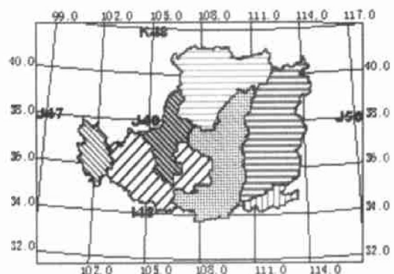
图 2 INDEX COVERAGE 结构

TILE 工作空间也可以通过 CREATE-Workspace 命令生成,用该命令生成的 TILE 工作空间必须在名字和位置上与 INDEX.PAT 属性表中 TILE-NAME 和 LOCATION 2 个字段值相同。