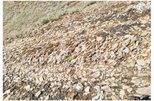
图 12 曲水县冻融作用的影响