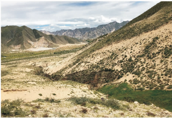
图 10 曲水县集水区沙地的侵蚀沟

对位于曲水县水土保持示范园附近集水区的调查发现,在原有风积沙地地貌上发育有各种侵蚀沟。既有暂时性的细沟,也有较为强烈的侵蚀沟(图 10)。