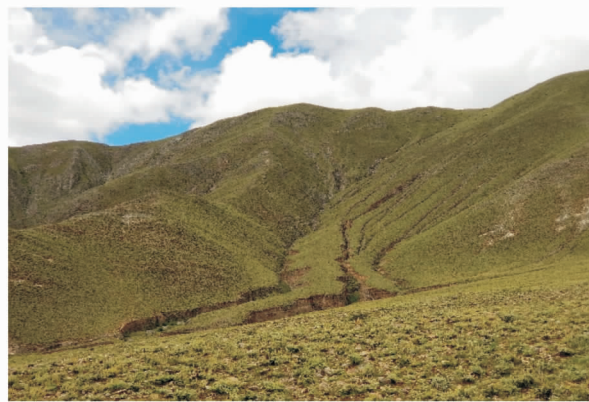
图 7 拉萨市马乡集水区的坡面侵蚀沟

降雨初始便开始产流并携带大量泥沙汇流于沟道,形成径流侵蚀。调查区内沟道侵蚀主要表现为两种形式,即坡面上发育的侵蚀沟和洪积扇(台)上发育的侵蚀沟(图 7—8)。由于洪积扇(台)为松散堆积物,因此在此发育的侵蚀沟较为严重,且在拉萨市和日喀则市的调查区内较为多见(附图 5—6)。经测量坡面沟道深度和宽度均低于洪积扇(台)上发育的侵蚀沟。如在日喀则市郊的集水区坡面上发育的侵蚀沟平均深度约为 0.76 m,平均宽度约为 1.86 m;洪积扇(台)上发育的侵蚀沟平均深度为 2.02 m,平均宽度为 2.40 m,两者的差异较大(表 2)。其中洪积扇(台)面积 1.43 km 2 ,其上侵蚀沟切割剧烈,重力侵蚀作用明显,通过对无人机航拍影像解译提取的沟道信息分析可知,该洪积扇(台)上的侵蚀沟达到 41 条,总长度达 24.20 km,侵蚀沟密度 16.92 km/km 2 。侵蚀沟的发育造成了严重的土壤侵蚀,而且使河谷两侧人们赖以生存的阶地和洪积扇(台)支离破碎,沟深壁陡,人畜均较难通过,给当地畜牧业发展和交通都造成了较大的影响(附图 7)。