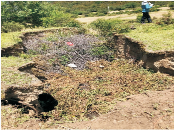
图 3 林芝市卡斯木村梯田的田面、田埂塌陷损毁情况(赵春敬摄于 20180813)