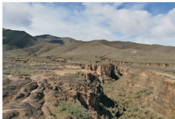
图 8 日喀则市郊附近集水区的洪积扇(台)侵蚀沟(焦菊英摄于 20180824)