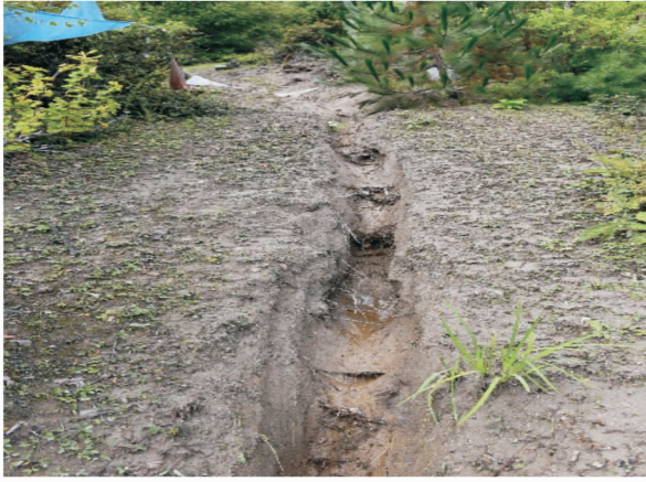
图 1 林芝市卡斯木村林地侵蚀情况(马波摄于 20180813)