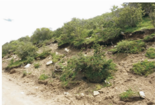
图 5 日多乡道路边坡的侵蚀情况