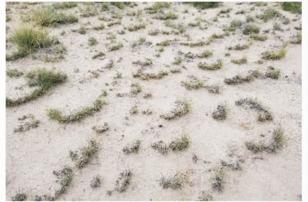
图 11 曲水县沙地侵蚀状况

冻融作用对侵蚀的影响往往通过风蚀或水蚀方式体现。冻融作用改变土壤结构等性质,从而导致土壤可蚀性变化,为风蚀和水蚀提供了更易获取的物质来源。此次调查中,对冻融作用影响的调查有限,然而,海拔较高山脊附近区域,植被缺失,冻融作用导致岩石破碎,地表物质松散,极易被风力和水力搬运(图 12)。