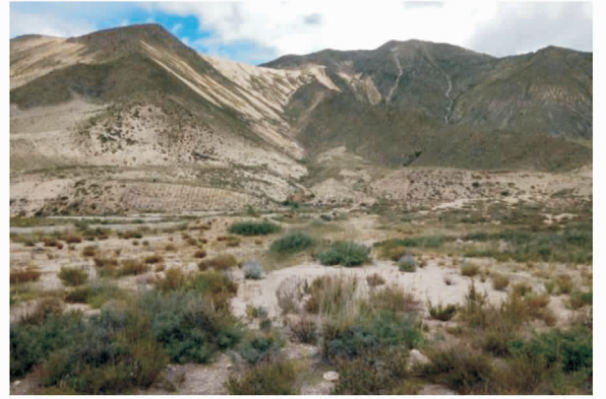
图 9 雅鲁藏布江(上)和拉萨河(下)山坡沙丘(张加琼摄于 20180819)

对位于曲水县水土保持示范园附近集水区的调查发现,在原有风积沙地地貌上发育有各种侵蚀沟。既有暂时性的细沟,也有较为强烈的侵蚀沟(图 10)。