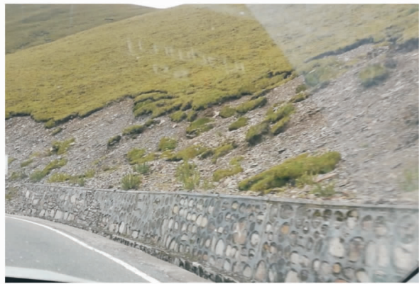
图 6 日喀则市浪卡子道路边坡上方的侵蚀情况(焦菊英摄于 20180826)

3.2.2 宽谷区风水复合侵蚀 拉萨和日喀则市调查区内,在雅鲁藏布江、拉萨河及年楚河流域的宽谷河床及两面山坡上分布有大量的风积沙(附图 8—9)。河流在风水季节搬运的泥沙在枯水季节出露,冬春季强劲的河谷风将河床出露的沉积物向两侧山坡搬运,形成爬升沙丘,部分沙丘在地形陡峭的区域受阻下落或翻过山脊下落沉积于山坡另一侧形成下落沙丘(图 9)。沙丘覆盖区域,植被因原有被埋藏新植被难以在流动沙地上生长从而形成大片的沙地。在雨季,这些极易被搬运的风积沙在降雨和坡面径流作用下重新被搬运进入河流,对河流泥沙搬运贡献巨大。