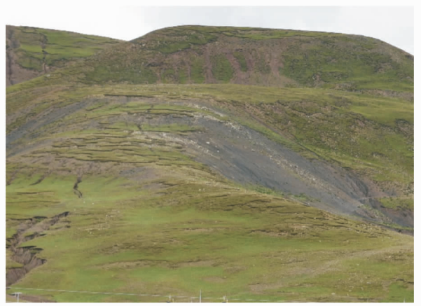
图 2 江孜龙马乡以东草地退化状况(焦菊英摄于 20180826)